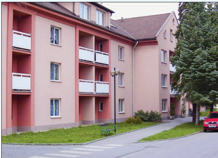
Oblastní charita Bystřice pod Hostýnem sídlí v Domě s pečovatelskou službou v ul. 6. května 1612. Nachází se zde kancelář Charitní ošetrovatelské služby a prostory Charitní pečovatelské služby - prádelna, pedikúra a kadeřnictví.