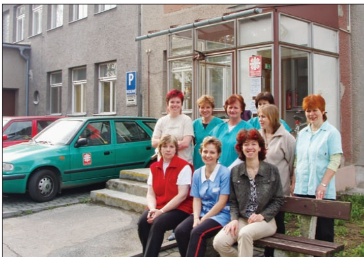
Zázemí pečovatelek a kancelář vedoucích Charitní pečovatelské služby v ul. 6. května 1071 (naproti zdravotního střediska za „Optikou“).